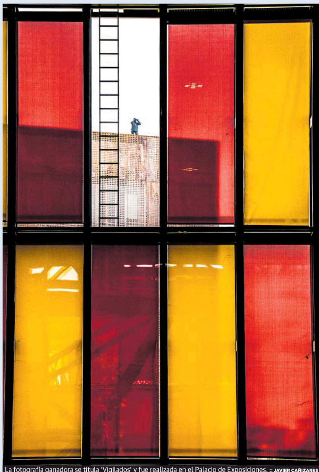
La fotografía ganadora se titula 'Vigilados' y fue realizada en el Palacio de Exposiciones.

Javier Cañizares gana el concurso de fotografía de la Cámara de la Propiedad Urbana