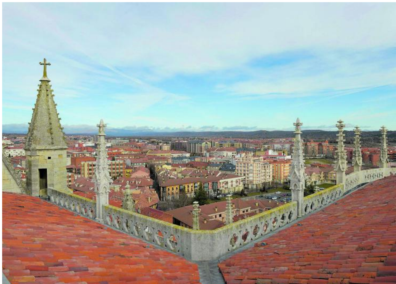
Vista general de la ciudad de León tomada desde la cubierta de la Catedral.

Valoración de la respuesta del Gobierno ante la pandemia