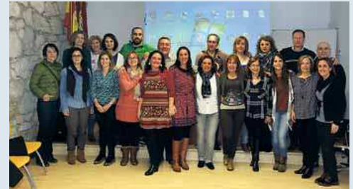
Foto de familia de la entrega de diplomas del curso de buenas prácticas.