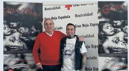
El tatuador leonés con el presidente de Cruz Roja de León.